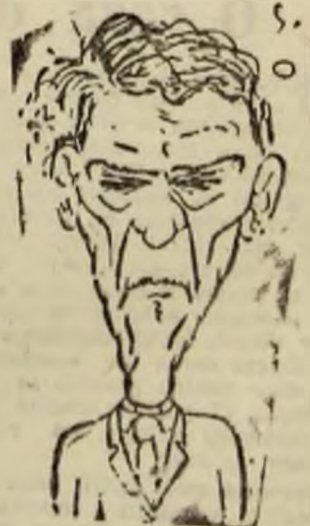
CORNELIU COPOSU : Au făcut ce-au făcut și P.A.C.! — Ne-au luat cheia... Caricaturi de ZOLTAN SZABO