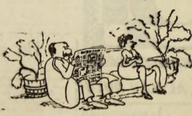
— Să fie foarte clar ! Prima dată mergem la mare şi după aceea n-ai decît să candidezi cît vrei !