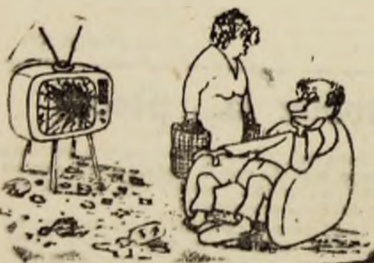
— Iar au intrerupt meciul cu reclame ?

Mai rămîne doar ca Primăria să găsească o soluţie prin care să repună şi acest parc în drepturile sale. Doar o picătură de apă, o dată la săptămîni, e prea puţin. (G.C.)