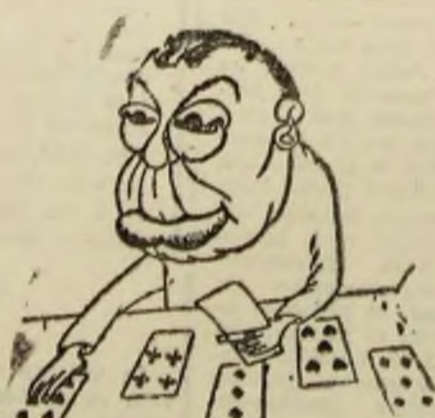
SILVIU BRUCAN : — Stupid people, stupid people, de ce nu iese pasența?