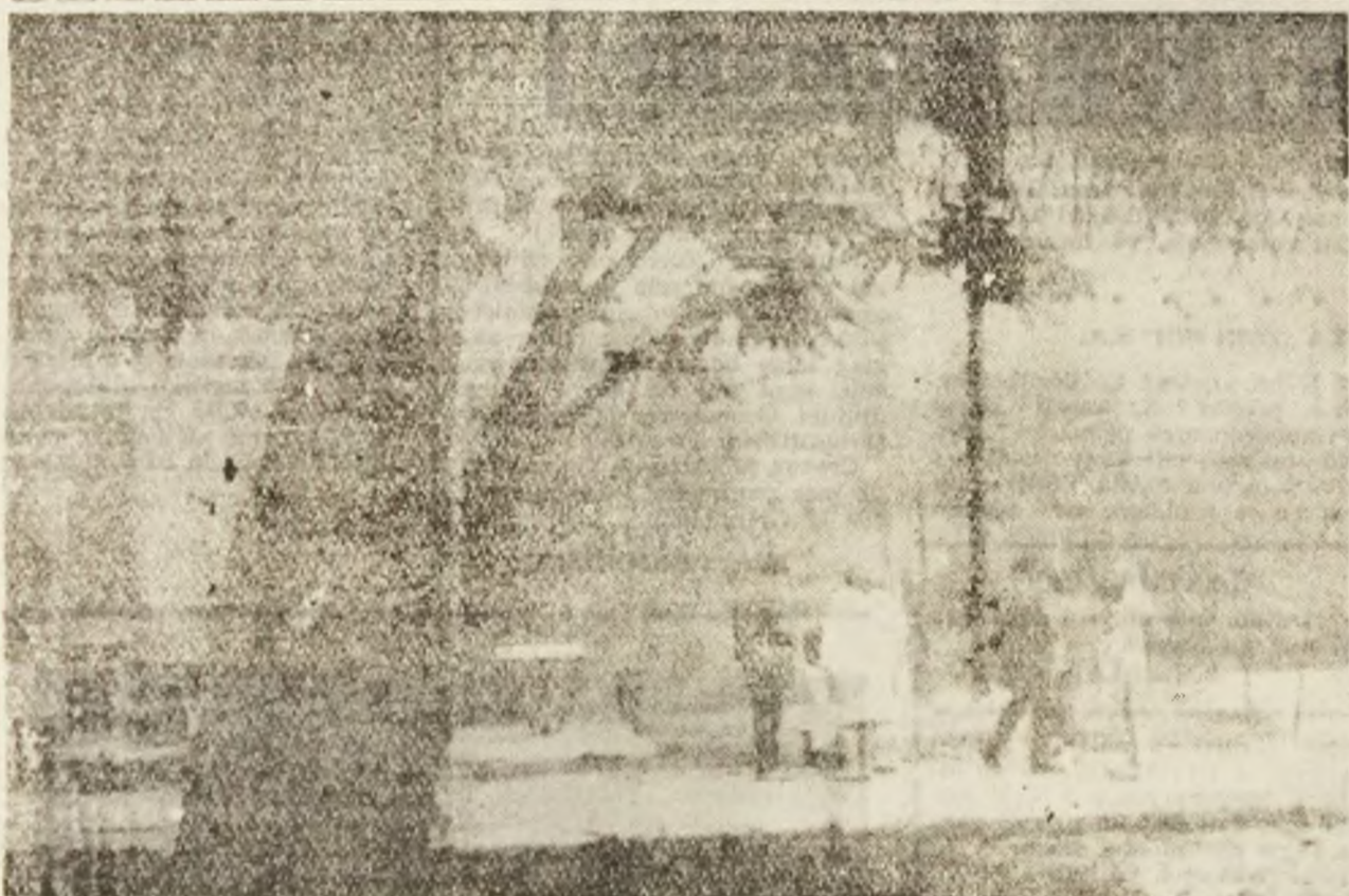
Din umbră, toate lucrurile se vad mai bine...