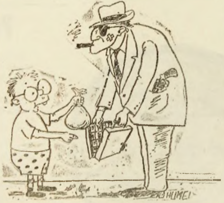
— Cîla vreme crezi că îți voi mai livra autrolac la prețul ăsta? Desen de Robert HUMEL.

ieri, 24 iulie, la intrarea în cartierul Aeroport din Petroșani, privitorilor ocazionali li se înfățișa o imagine idilică. Un ciobanaș cu clop și bită păștea vreo douăzeci de mioare pe spațiul verde dintre blocuri. Nu e prima oară cînd au fost văzute, în aceeași ipostază, cai, vaci, capre. „Tovarășul” preconiza să constituie centre agro-industriale în zonele rurale. Probabil că în condițiile actuale se dorește exact opusul, adică transformarea orașelor în centre industrial-agrare. Formula de adresare va suferi și ea modificări. În loc de „măi ciobane de la oi” se va folosi „măi domn' cioban de la oi”. (P.B.)