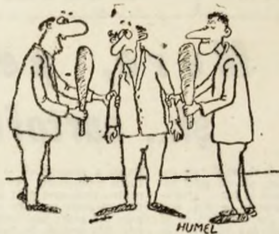
Ca să vezi că e democrație, îți dăm voie să alegi!

Se contează pe un mare număr de alegători și toate „forțele” sînt concentrate pentru alegeri libere și corecte. (D.N.)