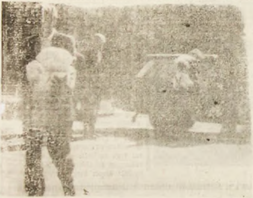
În jurul orei 13, la secțiile de votare nr. 203—204 din Vulcan au sosit... ajutoarele. Nu din străinătate, ci de la Primărie. Ele au conștat în pachetele cu muncă pentru membrii comisiilor respective.