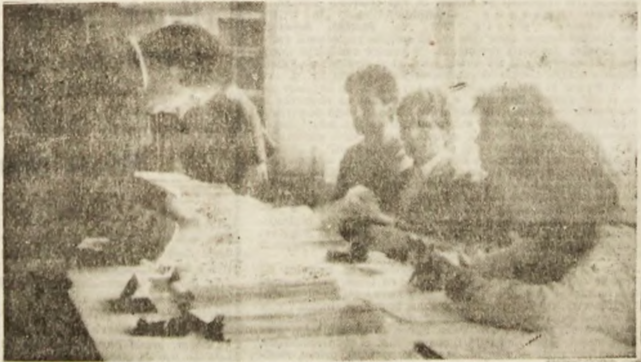
Cam așa a fost, duminică, la secțiile de votare.