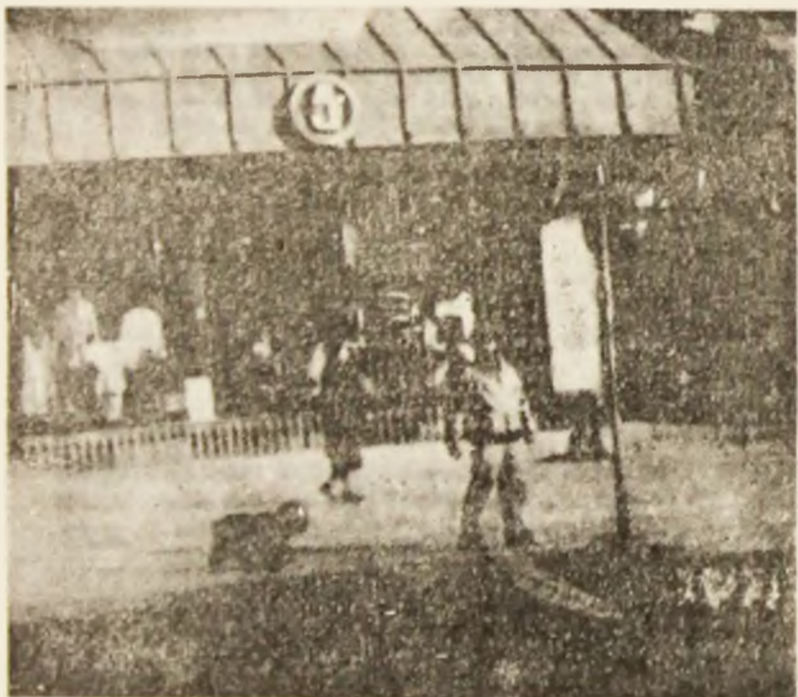
E vremea căteilor...