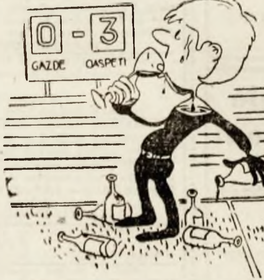
— De sportul ăsta m-am saturat pînă-n gît! I Desen de Vali LOCOTA