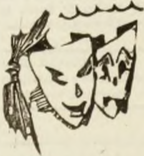
Ilustrația din această pagină este realizată de artistul plastic Ladislau Schmidt.