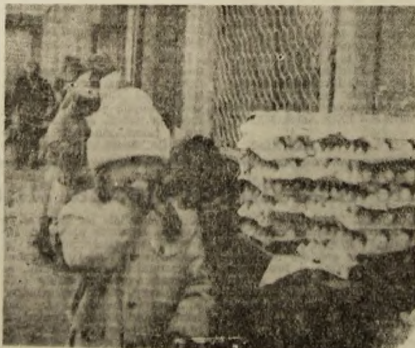
O il avînd, oul „bănuș”, dar dacă-l de leu, n-am făcut nimic!

— N-avea cum, doamnă, că și pe el l-a furat Dumnezeu, l-a răspuns (spre mirarea noastră) un cline vagabond scăpat neucleu de primarul Stolcuța.