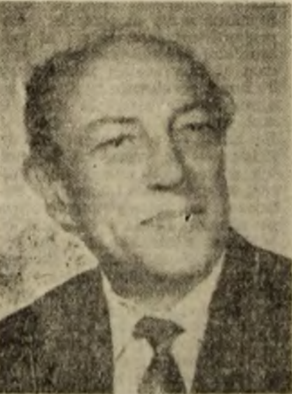
GHEORGHE ANA, deputat de Valea Jiului al F.D.S.N.

— În primul rînd, să fie pace în România, în țările vecine, și pe toată planeta. Să aibă fiecare om posibilitatea de a munci, ca ființă umană. Fiecare să-și ocupe locul pe care și l-a cîștigat — PE MERIT — în ierarhia socială și să aibă siguranța protecției la care este îndreptățit.