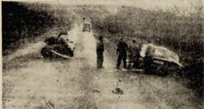
Cei care s-au grăbit, pe ceață, așa au pățit...

dova are calitatea de invitat permanent. Microfonul nr. 8 este „al ei”. De la acest microfon, prin vocea ei, lumea a aflat că mai există încă tristețe și suferință. A făcut și propuneri pentru îmbunătățirea Constituției. „Am satisfăcut faptul că nu muncesc degeaba”.