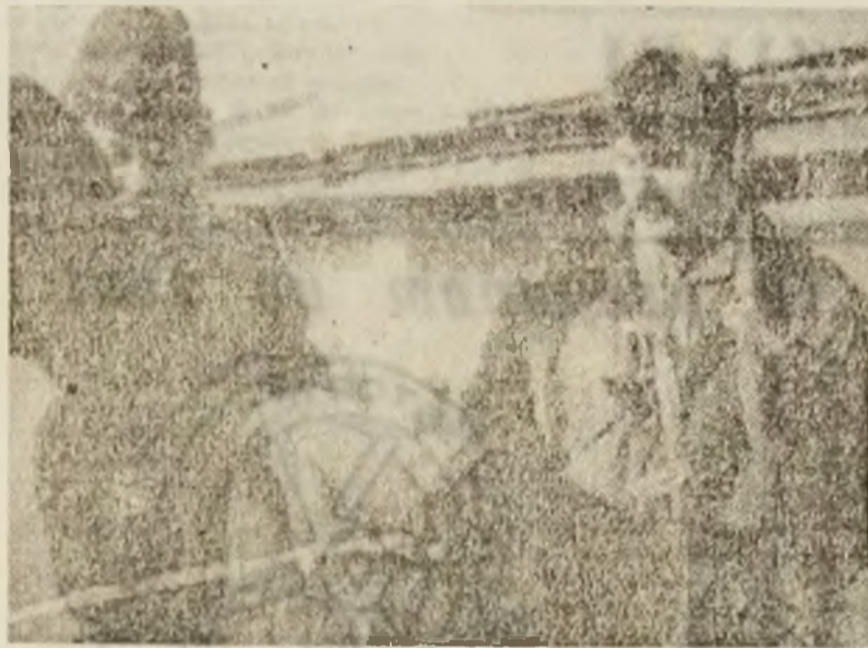
OMNIA MEA MECUM PORTO