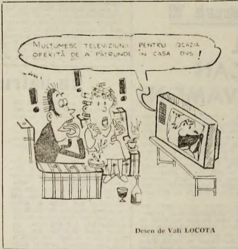
Desen de Vali LOCOTA