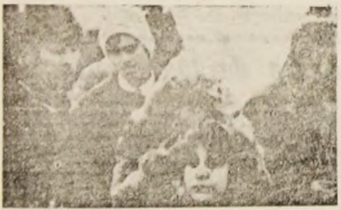
Piața — la ora micului dejun.