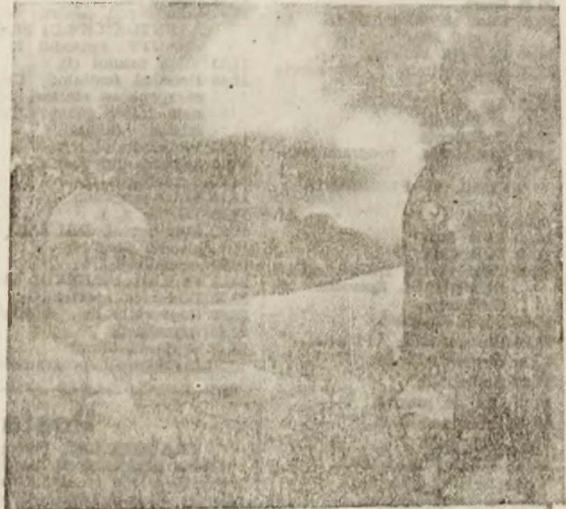
Azi, în Straja. Raliul național Salvamont