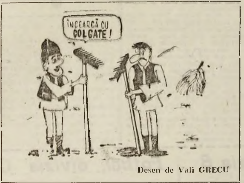
Desen de Vali GRECU