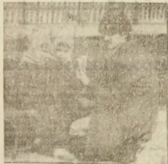
De-acum nu ne mai înghețăm nasul și picioarele.

Volantul adevărului este greu de condus. (D.N.)