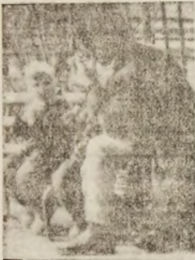
— De ce fumezi iar, tăticele?

„Salvăm Valea Jiului” a izvorât din neliniștile unor cadre de specialitate din minerit, neliniști legate de un viitor plasat dincolo de anul 2000. Desigur, sunt avute în vedere și problemele curente ale municipiului. Cert este că membrii fondatori își asumă greul muncii de pionierat ale cărei roade pot fi ușor anulate de orientările economice ale viitorului. Munca însă trebuie făcută cel puțin pentru ca generațiile următoare să nu privească înapoi cu mânie, ci să aprecieze cu un minim de recunoștință pionieratul fără de care nu se realizează nici o mare împlinire socială.