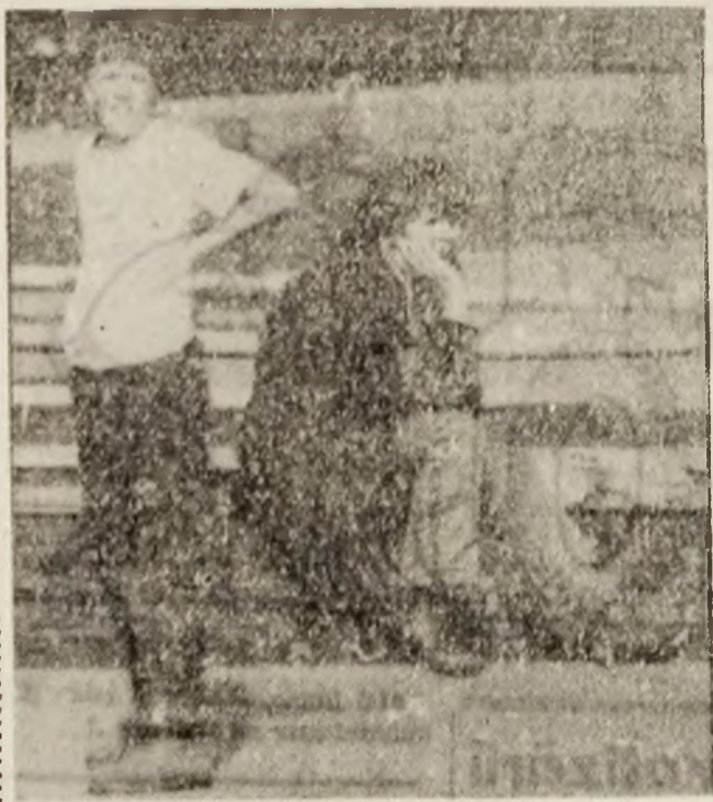
— Dacă dă căldura, iar trebuie să-i iau, astuia, adidași...