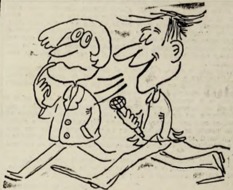
Domnule Măgureanu, dacă nici în seara următoareți cărciumi nu dăm peste băieții de la SRI, lășm microfoane la cei de la Politiei! Desen de VALL LOCOTA

Compania cinematografică „Amblin Entertainment” care aparține celebrului regizor american Steven Spielberg, va începe curând filmările la o versiune cu actori a îndrăgitei serial „Aventura în epoca de piatră”, cu adevăratul ei titlu „Flinstonii”. Filmul va costa 40 milioane de dolari și va continua într-un fel povestea celor două simpatice familii prietene, pline de ticuri ale societății de consum, înrădăcinate încă din epoca de piatră pe continentul american. Cea mai mare grijă a realizatorilor a fost aceea de a alege distribuția. Ei au ținut neapărat ca actorii să dea viață personajelor, să fie cât se poate de asemănători cu desenele animate. Cât despre Dino, micul dinozaur pe post de cățel al familiei Flinstone, acesta a fost realizat în Studiourile Honson, aceleași studiouri care au produs și păpușile Muppets.