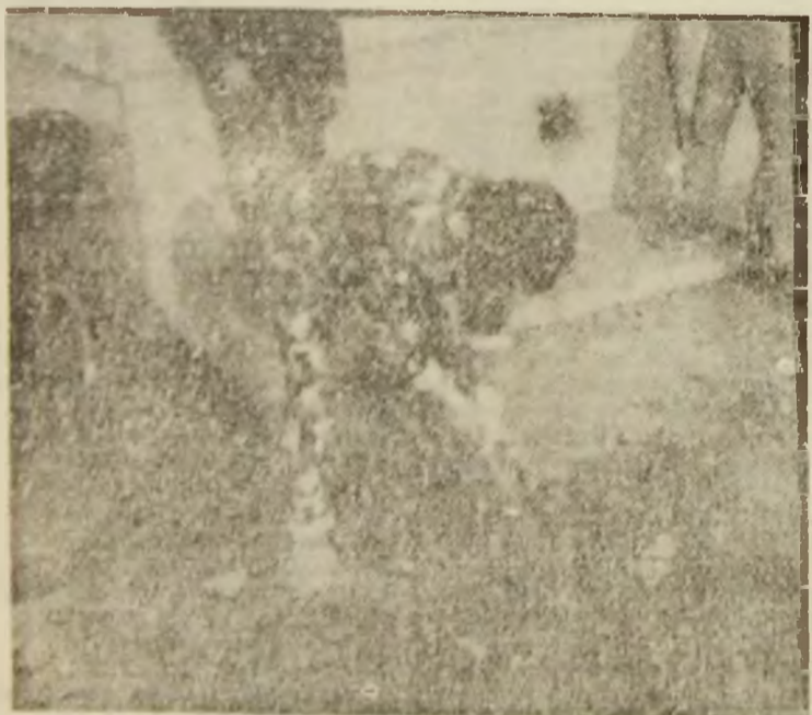
...să nu îngroape dosarele...