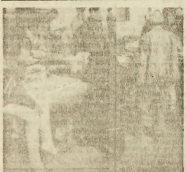
Muzică și zarzavaturi.