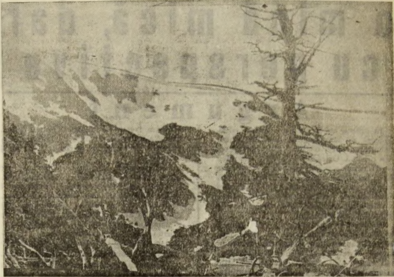
Pagină coordonată de Horațiu ALEXANDRESCU

Tristă e luna florilor, în ist an. Și tare săracă. De-a'ta economie de piață florile nu mai sunt grijite de nimeni. Păi cu ce să le 'grijească oamenii? Cu sapa de lemn? Că acolo au ajuns.