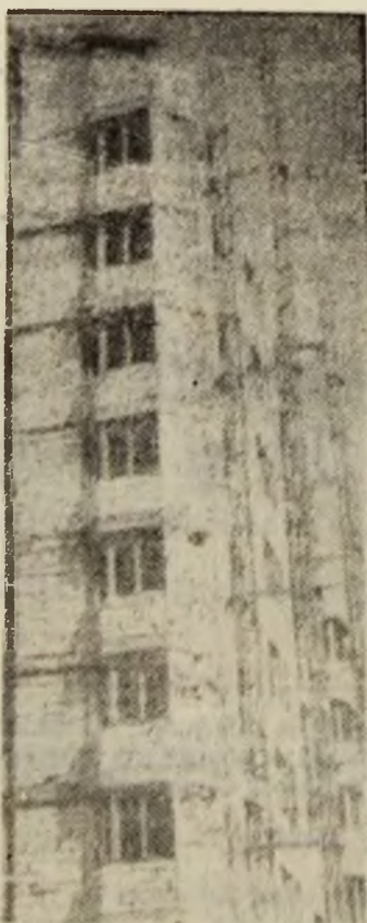
Imagine ce atestă o crudă realitate a Văii Jiului: blocuri nefinalizate încă, dinainte de 1989.

ETAPA VIITOARE, 15 mai: Femina Sf. Gheorghe — Indes Sibiu; IU Oradea — Colorom Codlea; CFR Tg. Mureș — Ardeleana Alba Iulia; Universitatea Petroșani — Mucart Cluj; Flamura Satu Mare — *.