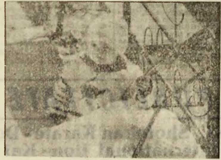
Tot pe mine mă lasă și cu ăsta micu'...

În pagina a 3-a Sport Apa noastră de toate zilele În pagina a 2-a Atenție, tuberculoza!