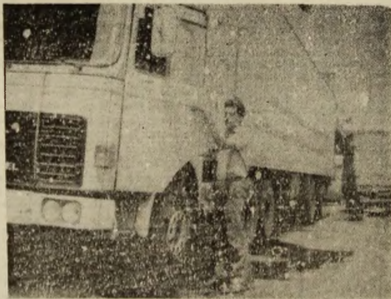
Ura și în CURSĂ !