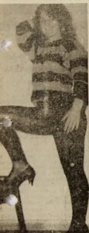
GGERI, IN CALDURI E VARA

DECI IAR AVEM „BAIRAM“ ELECTORAL — POLITICIA ASTA NE-A DAT GATA — IN ZIARE VEZI CĂTE UN SEMN BANAL PRECUM TRIFOIUL, ROZA SAU SAGEATA DECI IAR AVEM „BAIRAM“ ELECTORAL Buții dure se incing pe stradă Vechii se privesc pieziș, cruciș Și gospodipela se ciondănesc la coadă POLITICIA ASTA NE-A DAT GATA Măine votăm ai cătelea primar? Promisiuni fac toți, de vreo trei ani In van — orașul n-are gospodar IN ZIARE VEZI CĂTE UN SEMN BANAL Și apoi citești lozinci numai de bine Promite candidatul numai „miere“ Și cere-umil: „votați-mă pe mine!“ PRECUM TRIFOIUL, ROZA SAU SAGEATA Toți și-au ales un semn cât mai frumos Caci fiecare-n sinea lui tot speră Să prindă el acest nou „os de ros“ PRECUM TRIFOIUL, ROZA SAU SAGEATA IN ZIARE VEZI CĂTE UN SEMN BANAL — POLITICIA ASTA NE-A DAT GATA — DECI IAR AVEM „BAIRAM“ ELECTORAL.