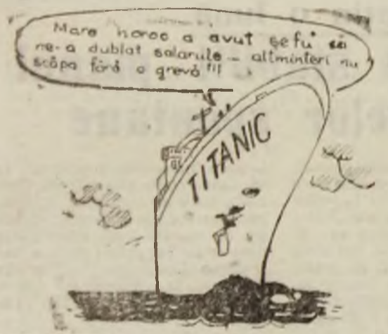
Desen de Vali LOCOTA