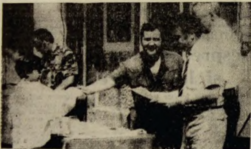
Festivitate de premiere la campionatele naționale de tir cu arcul, desfășurate la Aninoasa.

În încheierea manifestării, oficialitățile prezente au fost invitate la o masă festivă. Celorlalți li s-a oferit, la ieșire literatură religioasă.