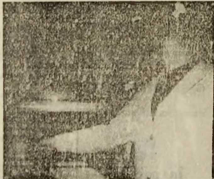
Măncarea noastră cea de toate zilele