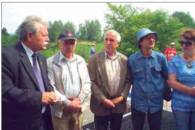
Primarul Ile prezintă oaspeților telegondola