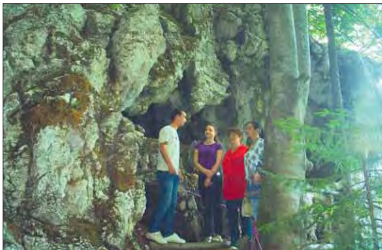
Vizită la Peștera lui Neag din zona pensiunii Retezat