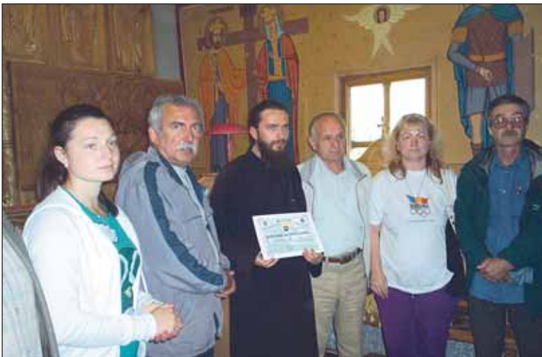
În interiorul Schitului Straja