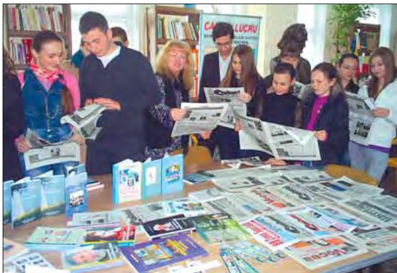
Interes deosebit pentru "Mineriada liceenilor" la Chișinău

Cred în vis! Căci realitatea Cruntă, ne va despărți Iar o lacrimă amară și prelinsă pe obraz Știu că poate să distrugă Tot ce-a fost și-a mai rămas. Vreau să cred că în uitare Se va pierde doar durerea Clipelor ce stăruiau așteptându-ți mângâierea Vino acum! și împreună, Să furăm din fericire Căci viața este moartă Fără urme de iubire!