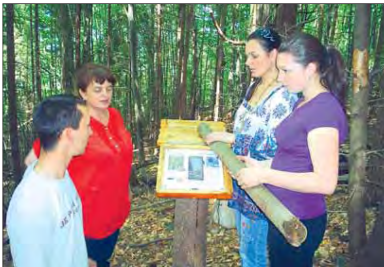
Vizită la poalele Retezatului