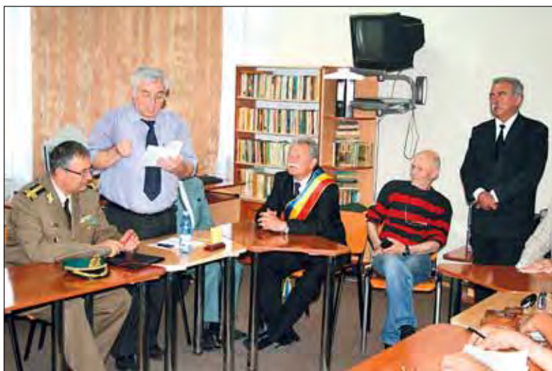
În sala bibliotecii Colegiului Tehnic "Mihai Viteazu"