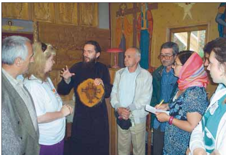
Semn divin - crucea din inima unui copac