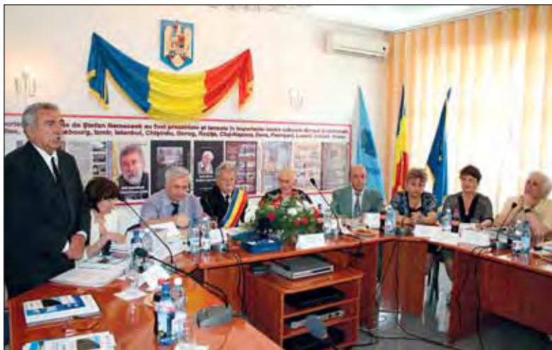
Cuvânt de deschidere în sala de festivități a primăriei vulcănene