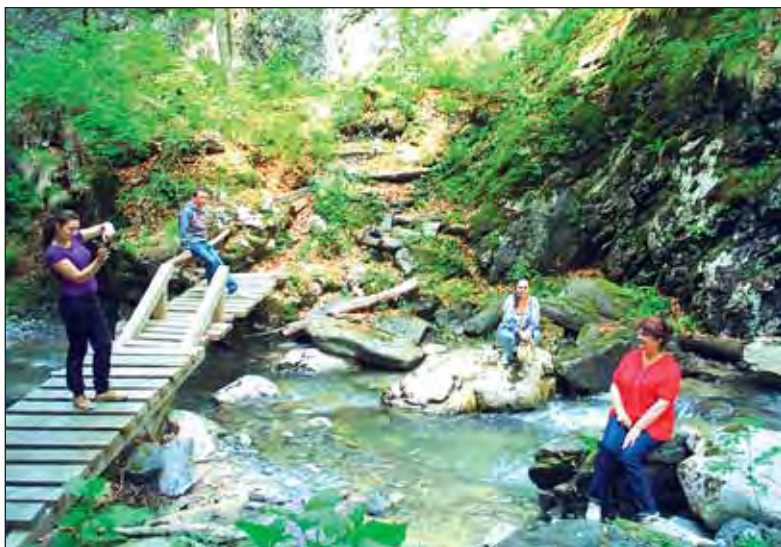
Amintri de neuitat...