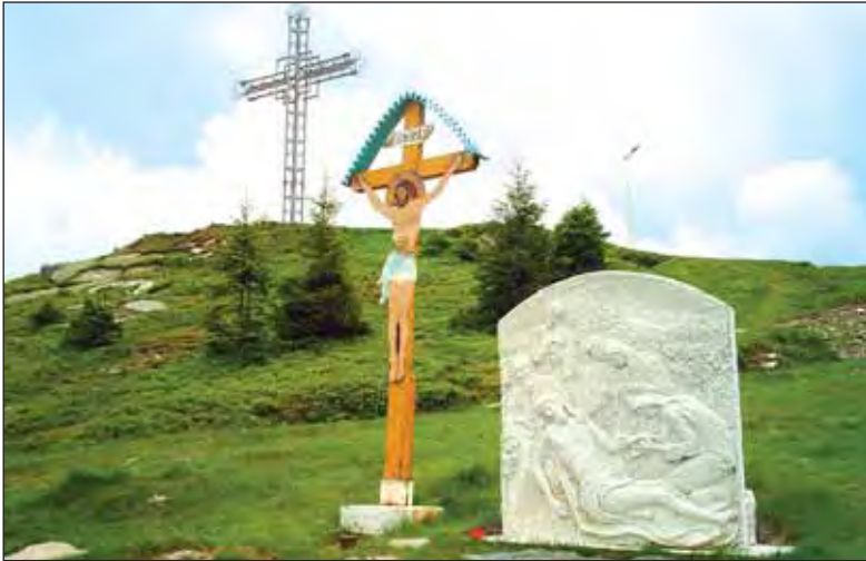
Straja - Crucea Eroilor