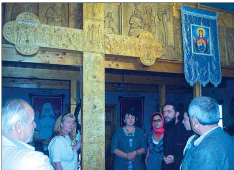
Crucea care are inserată o părticică din Crucea lui Isus