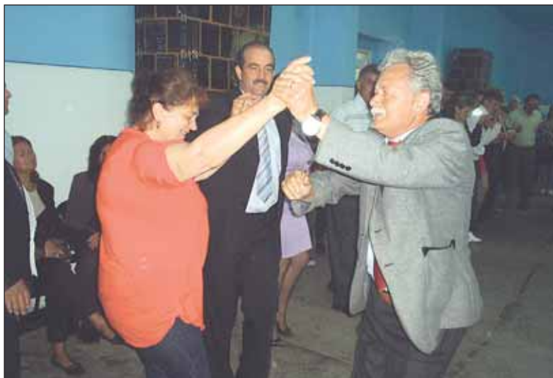
Viceprimarul de Borogani și primarul de Vulcan exersează în dans momârlănesc