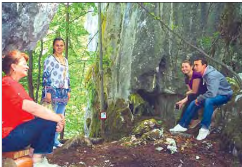
În pădurea din jurul pensiunii Retezat