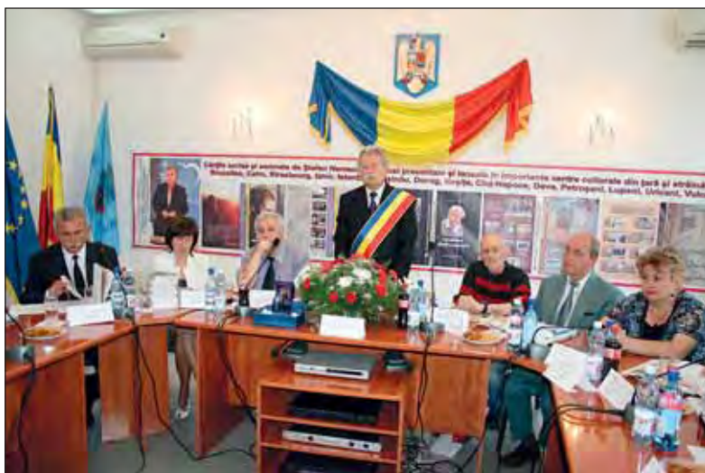
Vorbește primarul Gheorghe Ile, membru al juriului