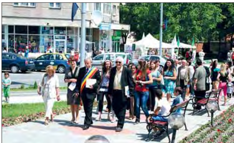
Pe Bulevardul "Mihai Viteazu"