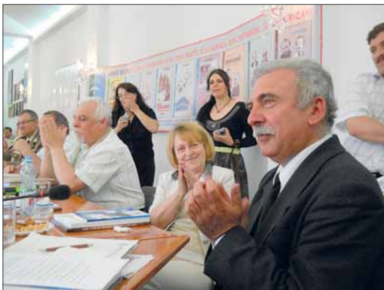
Aspecte din timpul festivității de premiere