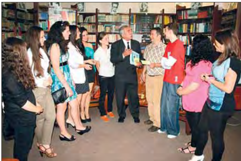
Dialog cu laureații