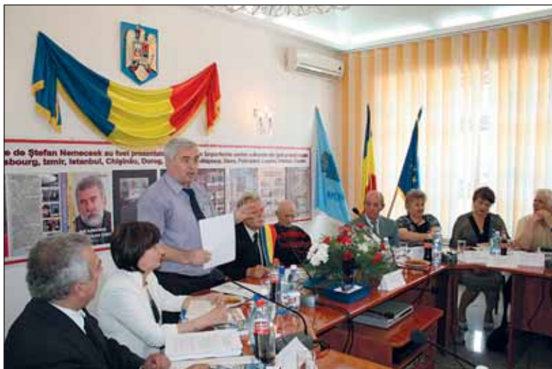
Vorbește scriitorul Ioan Velica