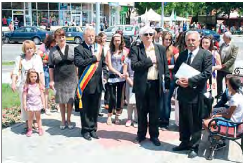
Se cântă Imnul minerilor în fața primăriei