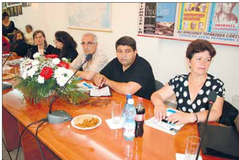
Oaspeți din țara lui Anton Pann