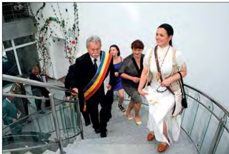
Pe scara interioară a primăriei vulcănene