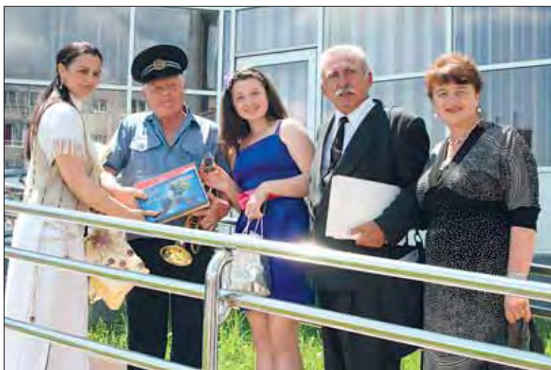
Salutări din Basarabia pentru fanfara din Vulcan