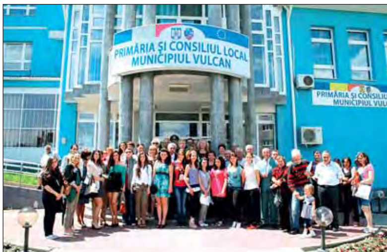
În fața primăriei Vulcan