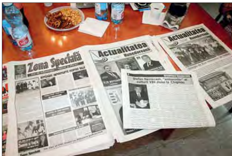
Ziare din Valea Jiului