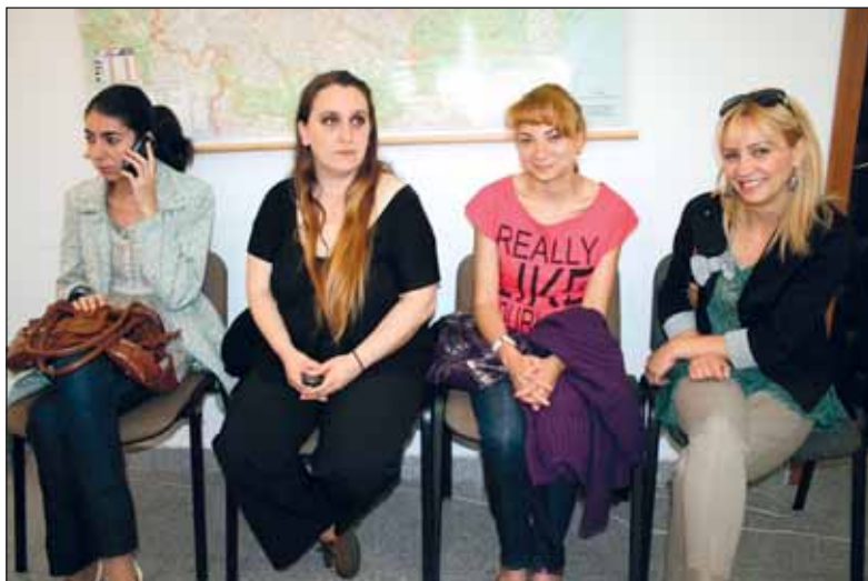
Cadre didactice de la Colegiul tehnic "Mihai Viteazu"