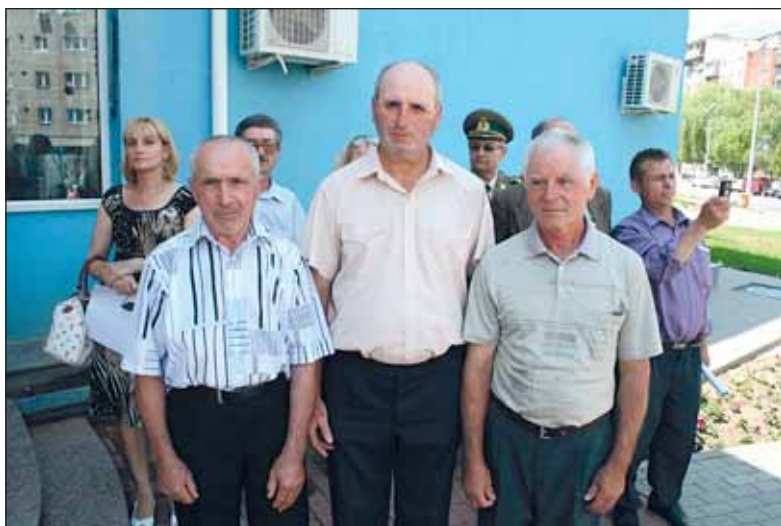
Reprezentanți ai Asociației "Cultul Eroilor"