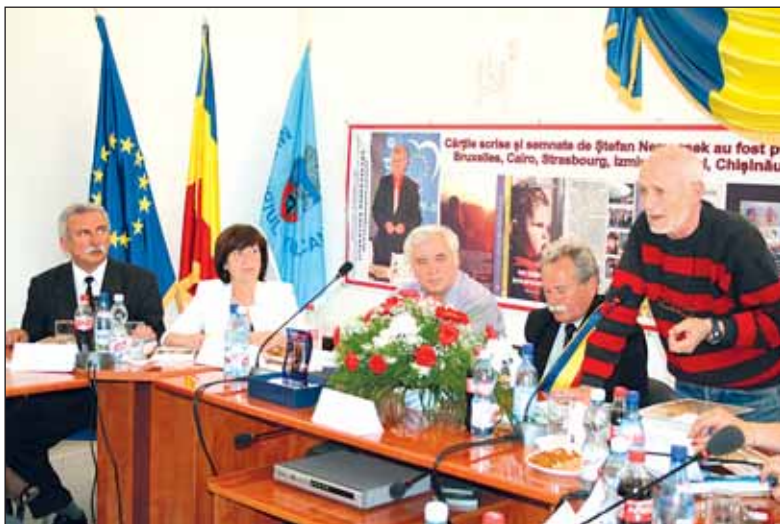
Vorbește membrul juriului - scriitoru Eugen Evu