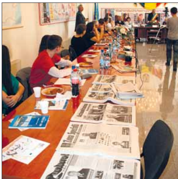
Expoziție cu ziarele din Valea Jiului