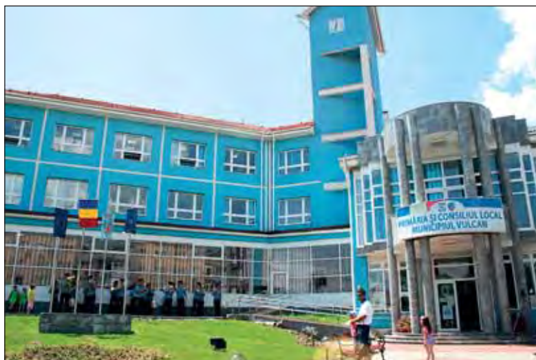
Sediul primăriei municipiului Vulcan