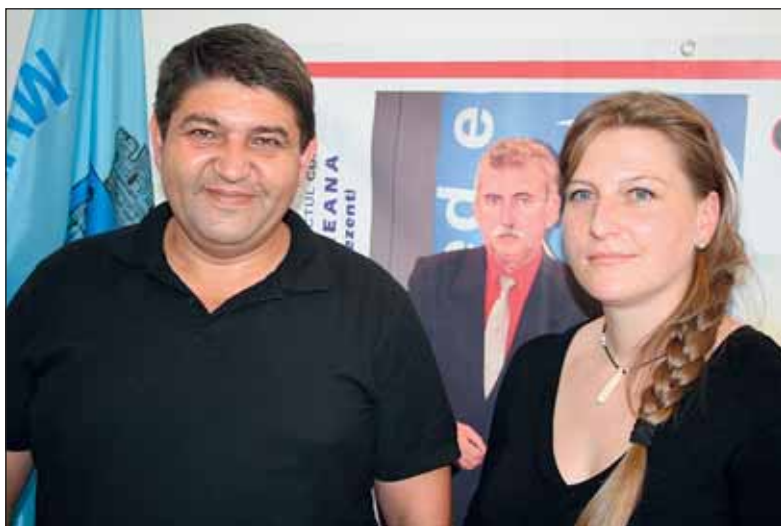
Oaspeți importanți din Râmnicu Vâlcea