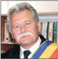
Gheorghe Ile primarul municipiului Vulcan