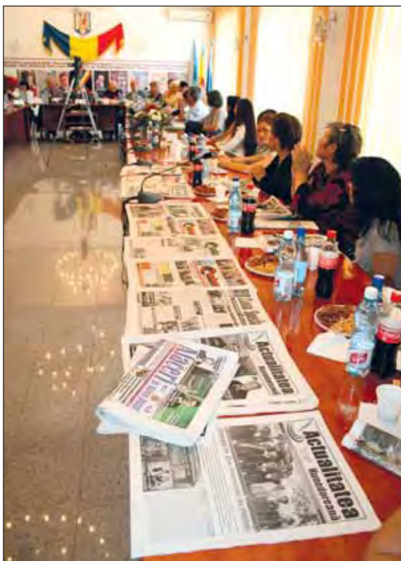
Ziare apărute în Valea Jiului