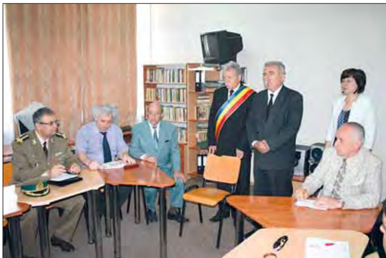
Cuvânt de deschidere la Colegiul Tehnic "Mihai Viteazu"