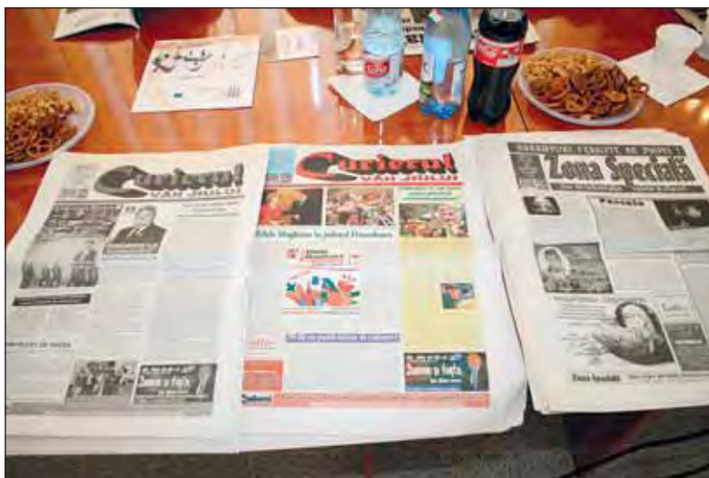
Ziare care au prezentat proiectul cultural "Mineriada literarpă a liceenilor vulcăneni"