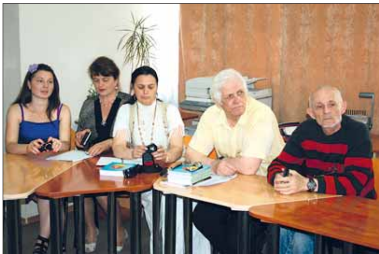
Lansare de carte la Biblioteca Colegiului Tehnic "Mihai Viteazu"