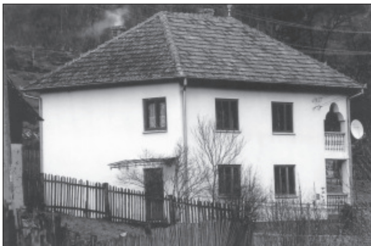
Una din cele mai frumoase case din Valea Poienii