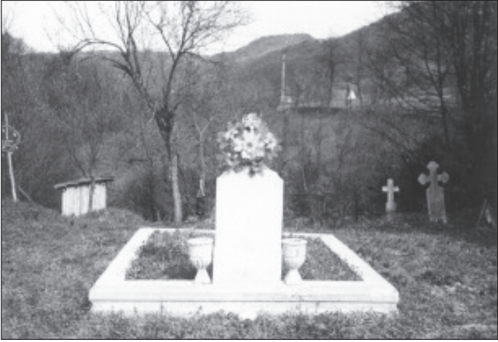
Semne ale celor ce au trăit odată în satul Visca