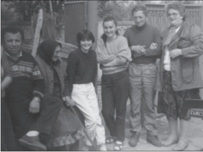
O întâlnire între neamuri