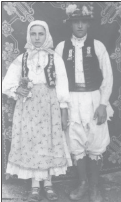
Portul popular în satul Visca

Au trecut câteva ore bune și iată-ne părăsind satul Visca, dar peste puțină vreme vom reveni. Dorința ce ne străbate este să împlinim această carte despre aceste locuri și aceste trei sate.