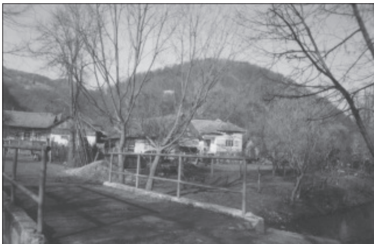
Intrarea în satul Valea Poienii