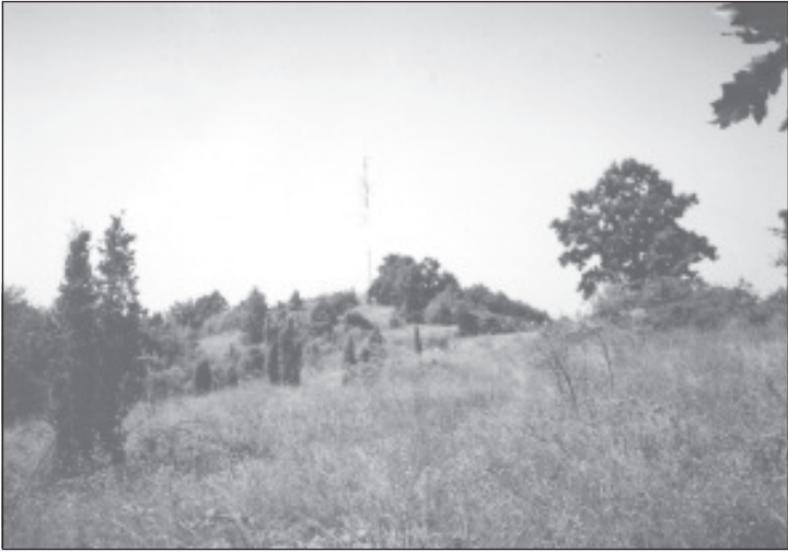
Vedere către releu