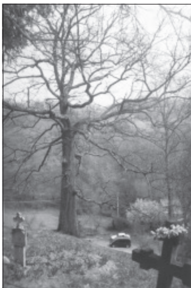
Stejarul din cimitirul Bisericii din Luncșoara