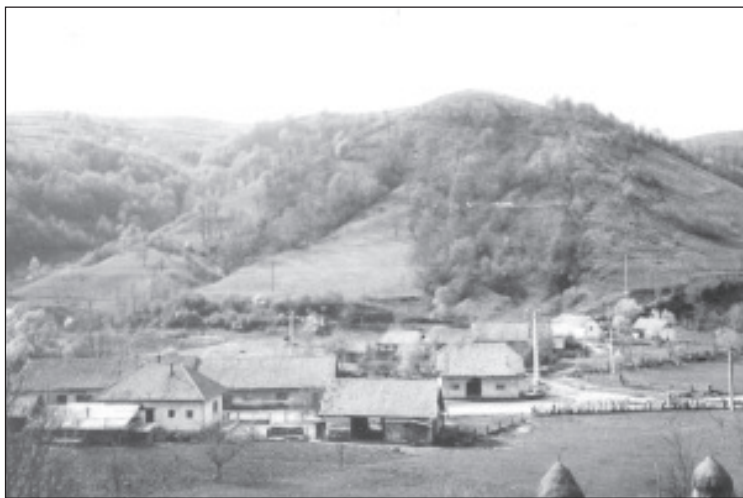
Un cârmp din satul Visca cu pitorescul ce vine din toate părțile

suplinind rândurile ce nu s-au scris. Pagini vii și nemuritoare în timp. Vă dăruiesc această carte pentru că astfel mă știu fericit, împlinindu-mi-se încă un gând.