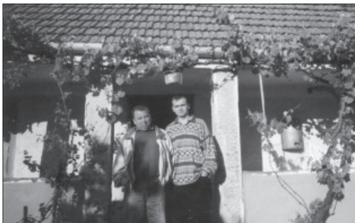
Tatăl și fiul într-o clipă de liniște