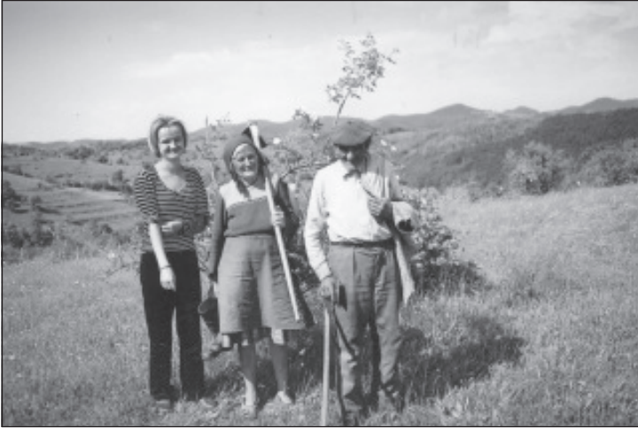
Dintre oamenii locului, care au fost și nu mai sunt