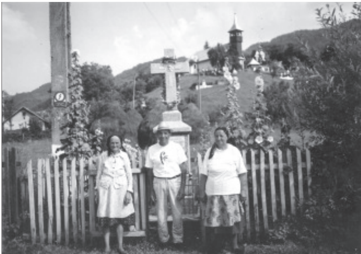
Clipe de liniste sufleteasca in fata Troitei si a Bisericii

Ce pățanie am tras când am pierdut caprele și le-am găsit a doua zi la Valea Șurii? Îmi amintesc și de vremea războiului când veneau zeci și zeci de avioane de nu se mai vedea cerul. Într-o zi, cred că au fost două sute de avioane pe cerul satului Visca și, dintr-o dată am văzut cum unul s-a rupt în două și din el au căzut oameni. Unul a căzut pe o cămară a unui om din Lunșoara. Doamne, ce vremuri au fost și câte n-am trăit și uite că am ajuns anii bătrâneții, slabă și bolnavă. Dar, mă bucur că pot să povestesc despre satul meu natal, pentru a rămâne ceva scris din trecut pentru viitor.”