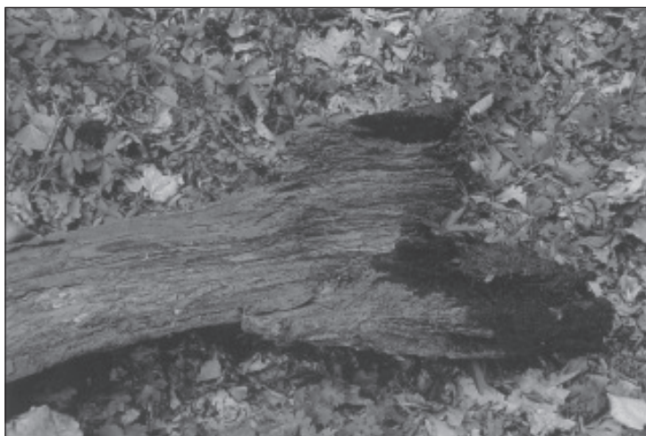
Mărturii din scăldătoarea din preajma conacului baronului de pe Dealul Gruii