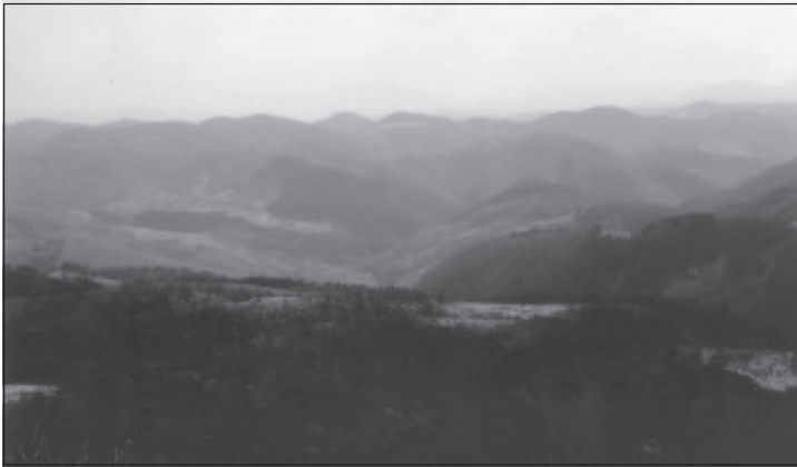
Fundurile de căldare din Poiana Mieza