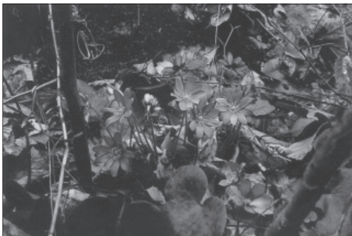
Florile - frumusețile primăverii