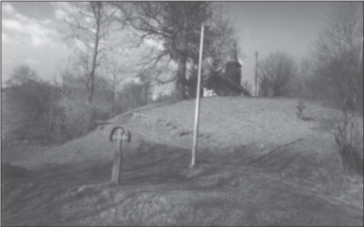
O troiță și biserica din satul Lunceșoara