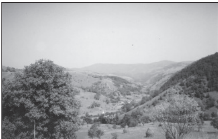
Vedere din satul Visca, cu dealuri, vâi și pășuni, și jos turla bisericii