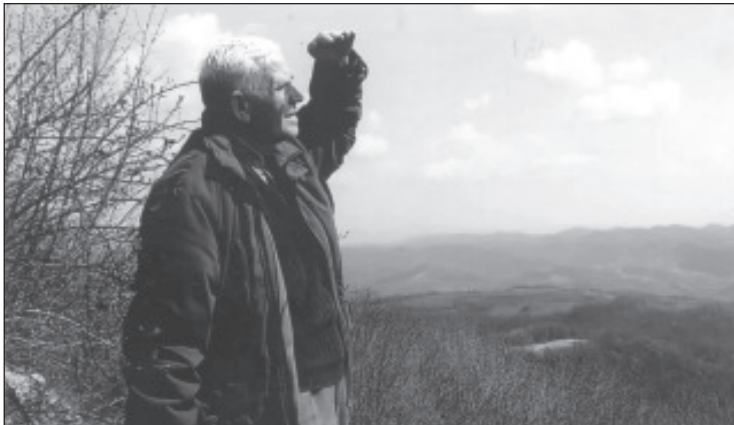
Autorul privind de pe Acoperișul Lumii

Se face seară și luminile se aprind în lungul Văii Poienii. Am călătorit printr-o zi scurtă de iarnă și, iată, că am ajuns la finalul ei. A fost o zi cu adevărat bună. Promitem că vom reveni. Anul 2007 bate la ușă. Nu spunem vorbe de hazard, chiar la început de ianuarie, vom parcurge drumul către Visca, sperând să avem o zi la fel de bună.