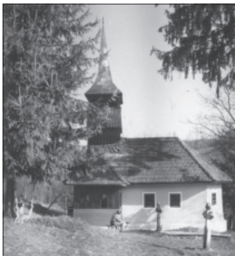
Biserica din Luncșoara