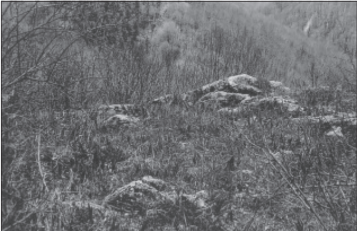
Pietrele albe de pe Dealul Gruii din Poiana Mieza