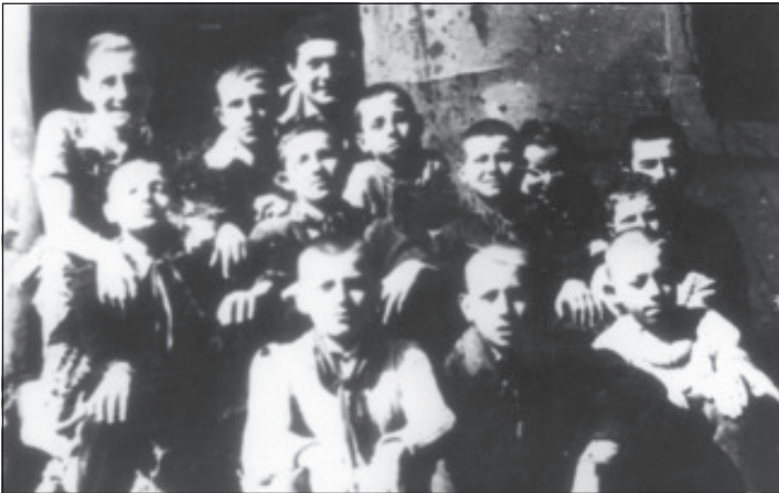
Elevii de altădată de la școala din Visca